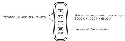
Рис. 2. Управление светильником